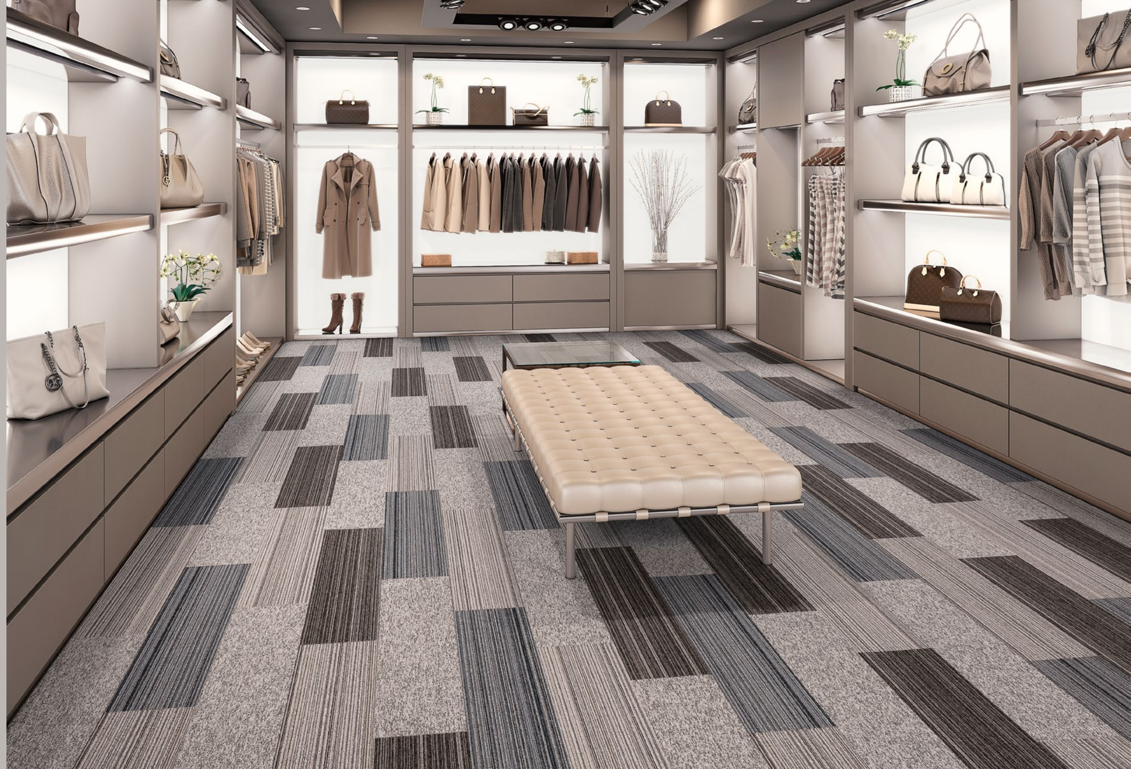
AGREGATTA FERRARA (002) / KHAKI (101) / TRENTO (005) / RAVENA (001) ▲