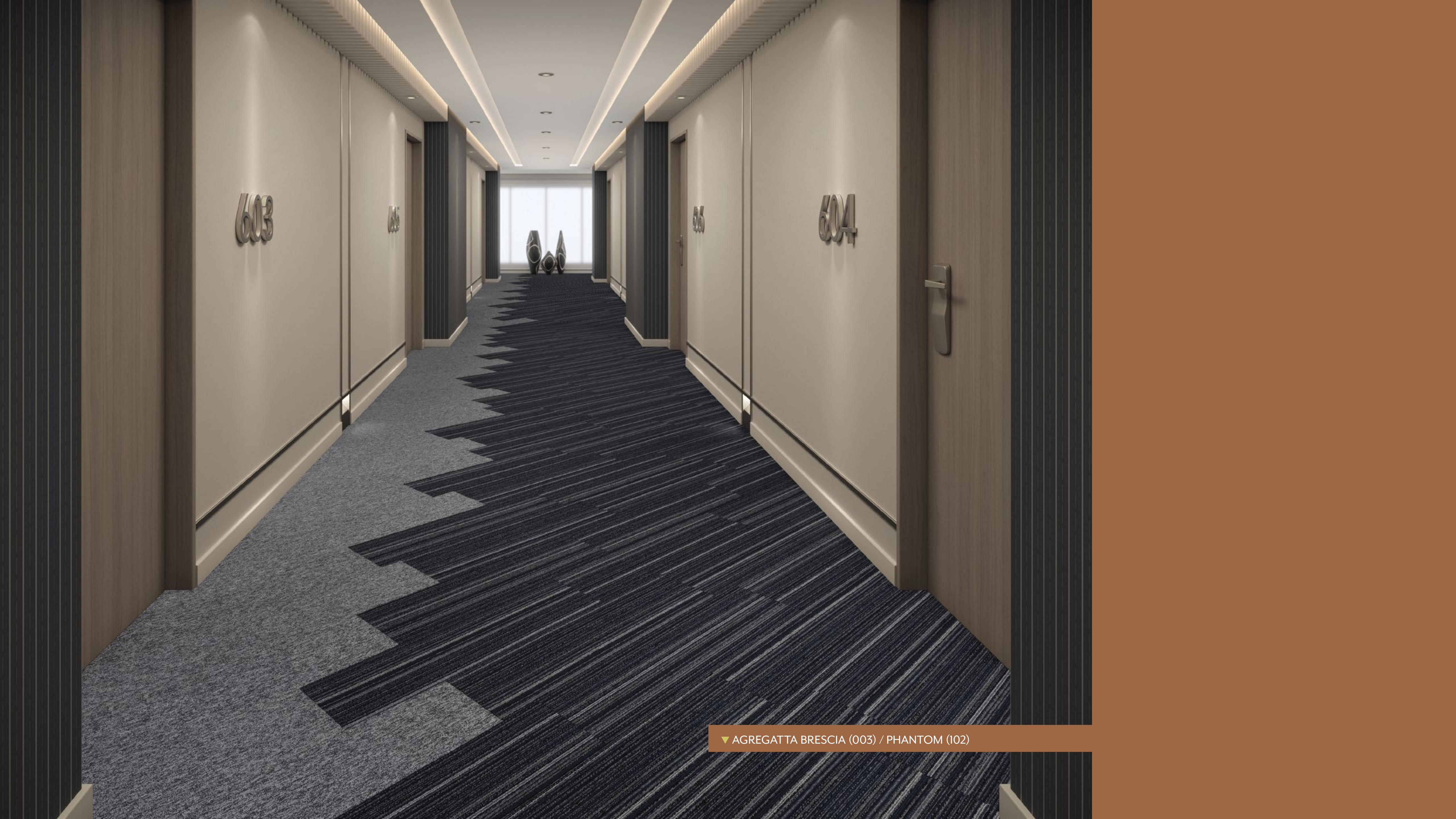
▼ AGREGATTA BRESCIA (003) / PHANTOM (102)