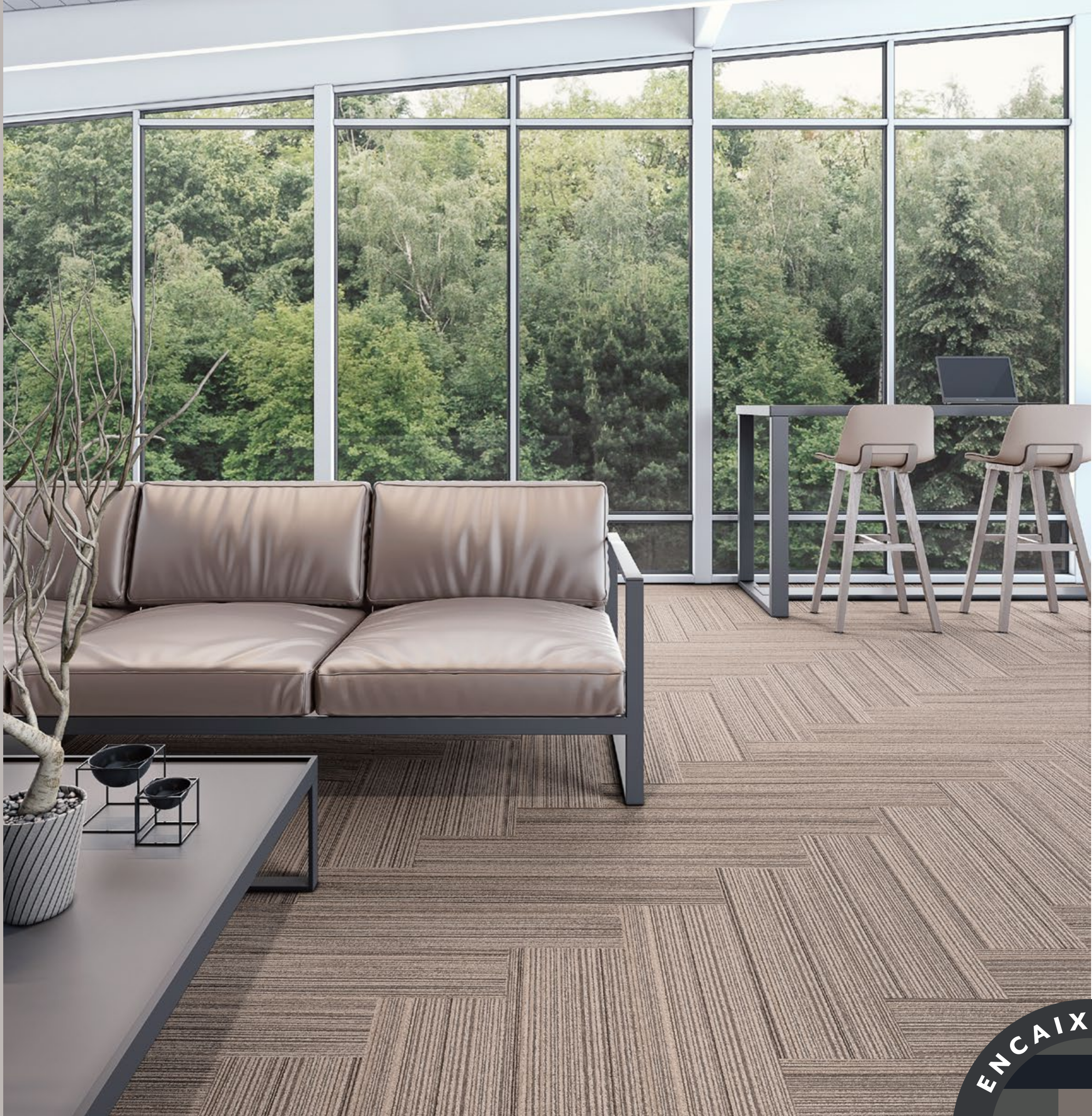
AGREGATTA RAVENA (001) ▼