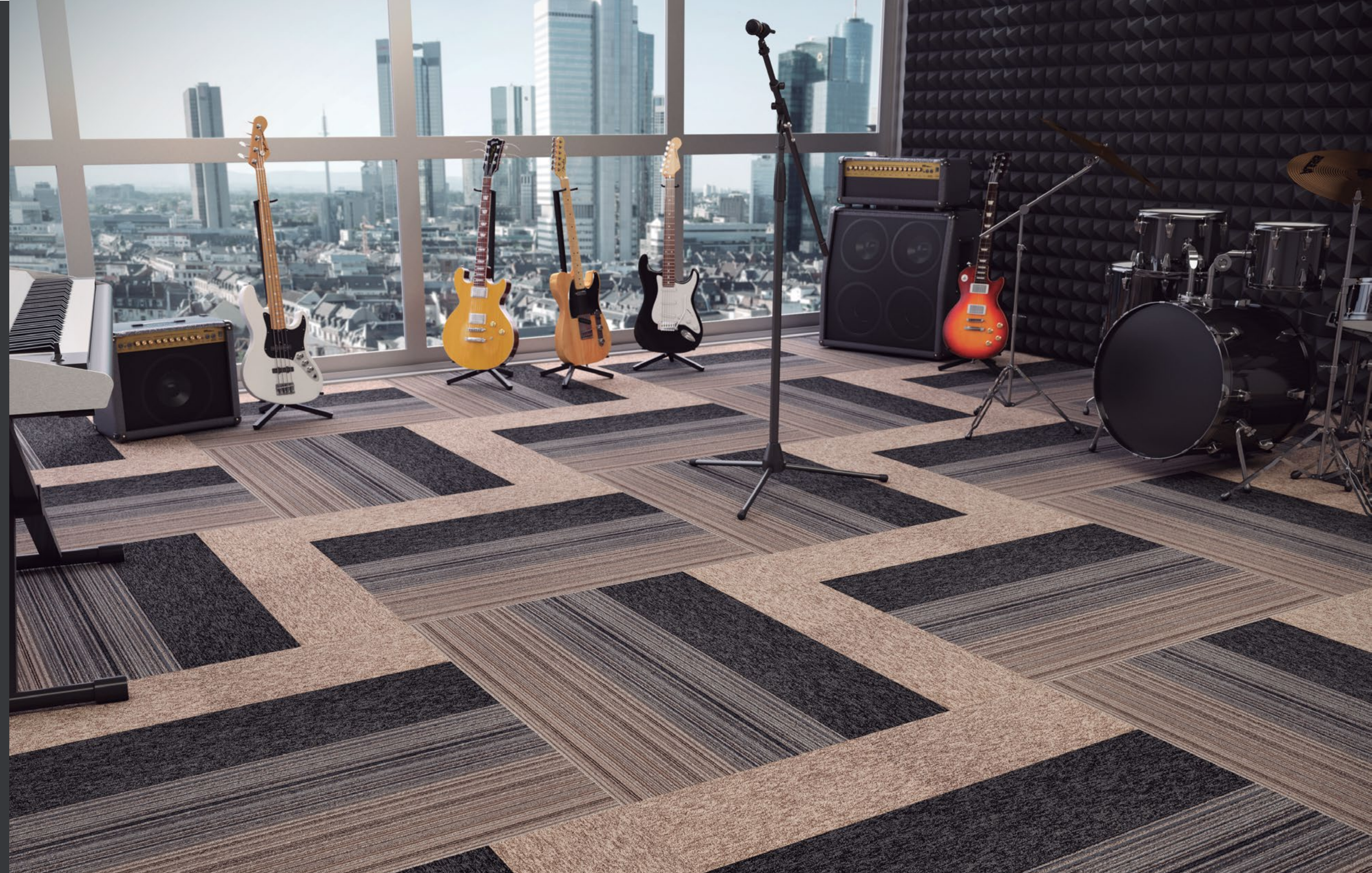
AGREGATTA RAVENA (001) / SEAL (103) / FERRARA (002) / KHAKI (101) ▲