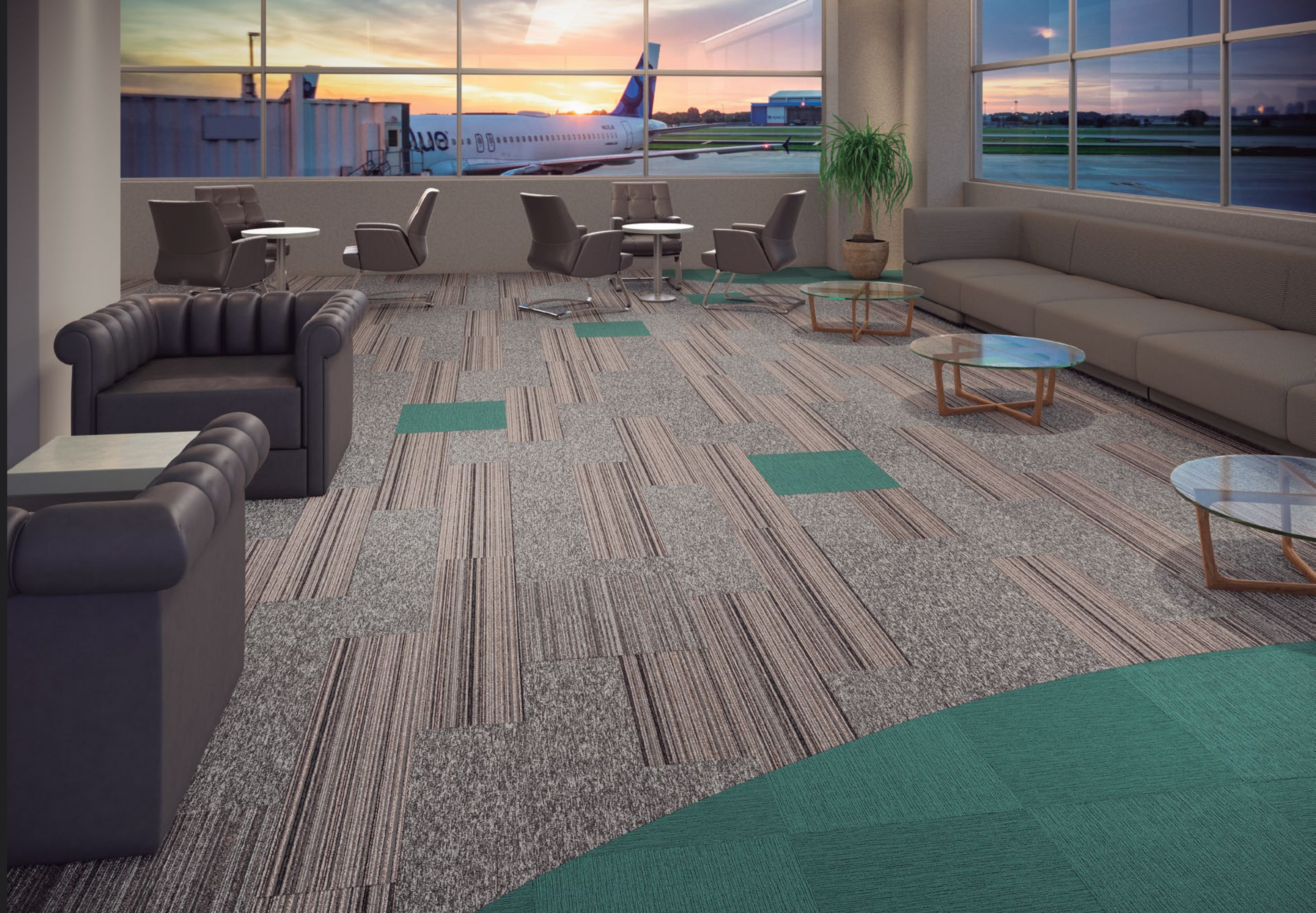
AGREGATTA KHAKI (101) / RAVENA (001) / TENDENCY COLLECTION VIBRANT GREEN ▼