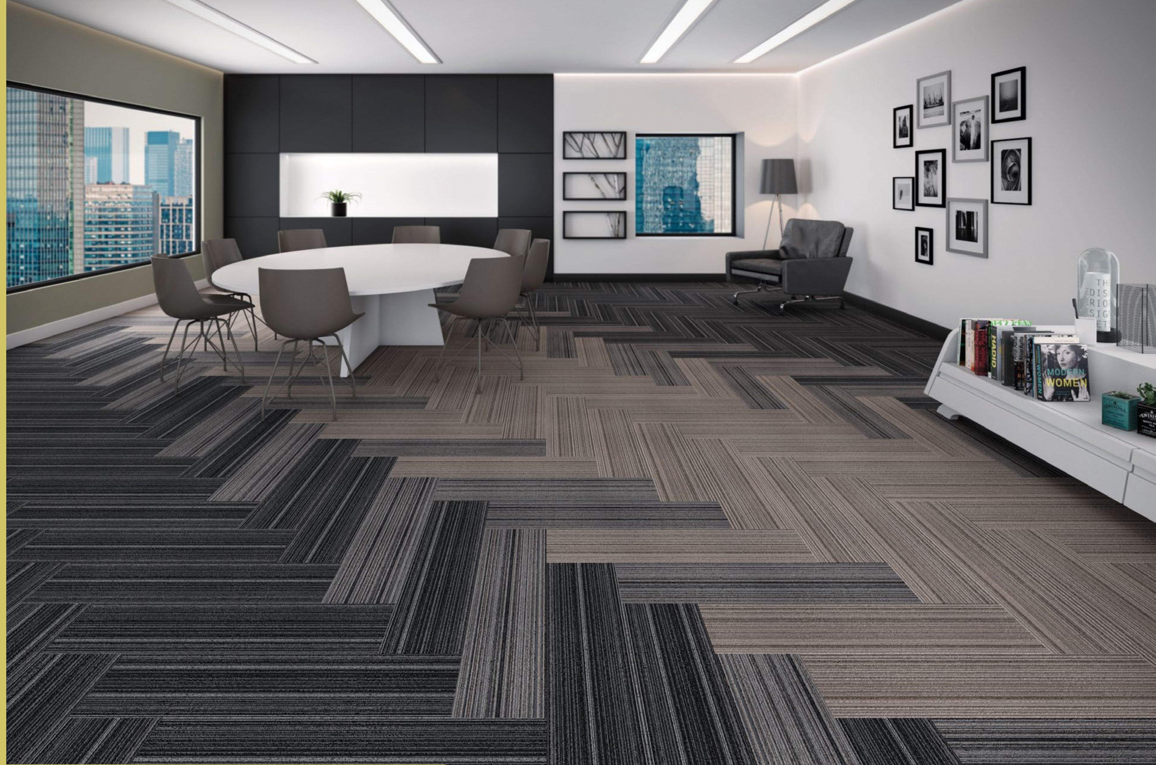
AGREGATTA FERRARA (002) / ÁQUILA (004) / RAVENA (001) ▲