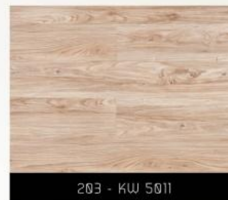
203 - KW 5011