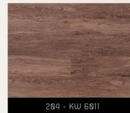
204 - KW 6011