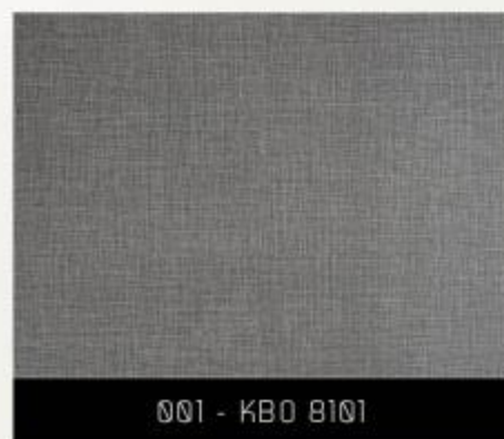
001 - KBO 8101