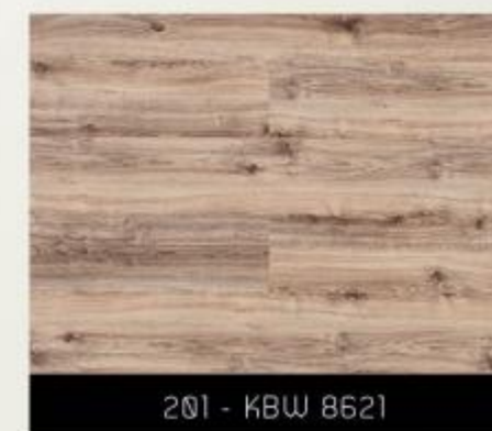
201 - KBW 8621