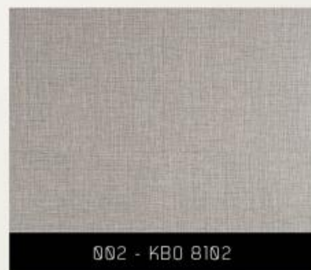
002 - KBO 8102