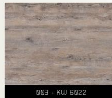
003 - KW 6022