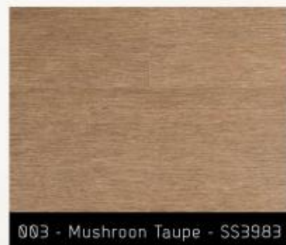
003 - Mushroom Taupe - SS3983