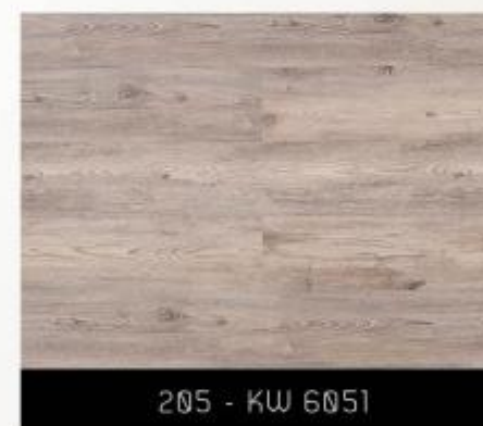
205 - KW 6051