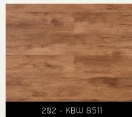
202 - KBW 8511