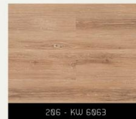
206 - KW 6063