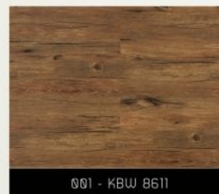
001 - KBW 8611