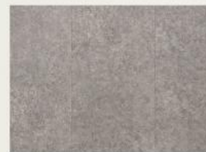
003 - Porcelain Grigio - SS2676