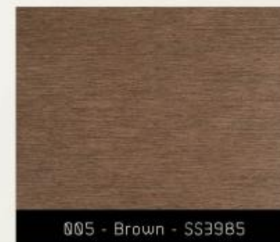
005 - Brown - SS3985