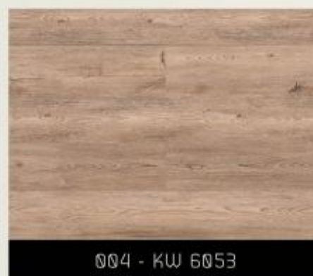
004 - KW 6053