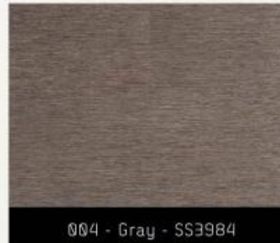
004 - Gray - SS3984