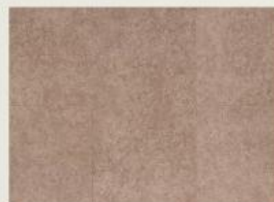
002 - Porcelain Rosa - SS2675

Newtown Clic está conectado às últimas tendências de decoração. Com textura de cimento queimado, é ideal para projetos comerciais de alto padrão que se diferenciam pela inovação. Seu moderno sistema clic permite uma instalação rápida e limpa.