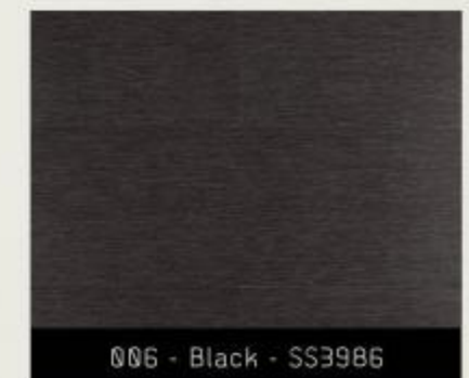
006 - Black - SS3986