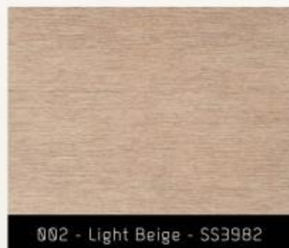
002 - Light Beige - SS3982