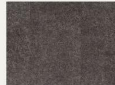
004 - Porcelain Nero - SS2677