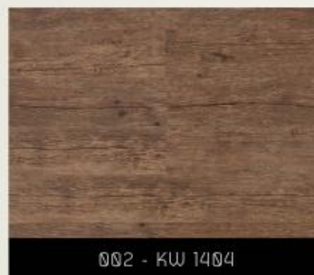
002 - KW 1404

Hercules deixa os ambientes mais contemporâneos e ousados. Com quatro opções de cores e texturas que fazem referência a madeira de demolição, é ideal para piso elevado. Hercules sempre dá um toque especial em todos os projetos.