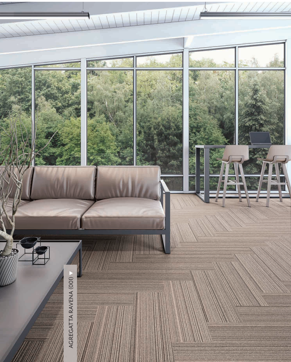
AGREGATTA RAVENA (001) ▾