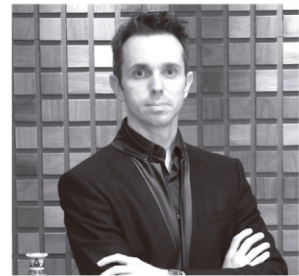
Arquiteto: Francisco Humberto Franck

CARPETE DIMENSION COOPERADO COM ESPAÇO DO PISO