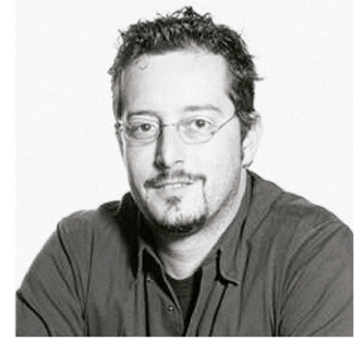
Arquiteto: Robson Gonzales

Sustentabilidade e acessibilidade inspiradas no Brasil