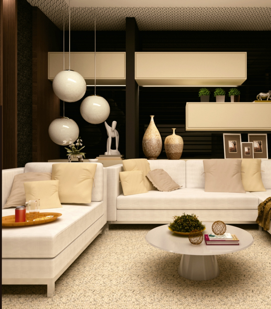
Web Cine - Mostra Valinhos Decor (SP)