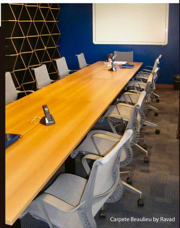
Carpete Beaulieu by Ravad

AFA - Andre Sá e Francisco Mota Arquitetos Rua Lucaia, 295 - Ed. Empresarial Lucaia, 3º andar Rio Vermelho, Salvador - BA CEP 41940-660 / Tel: (071) 3334-5166 www.afa.arq.br