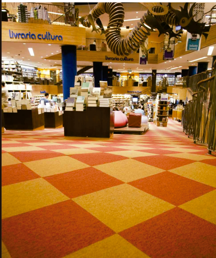
Carpete Beaulieu fabricado com fio Antron, by Casa Fortaleza