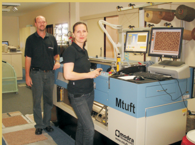
Máquina Mtuft para desenvolvimento de amostras

Na Beaulieu, um dos departamentos chave para o crescimento da empresa é o de desenvolvimento de novos produtos.