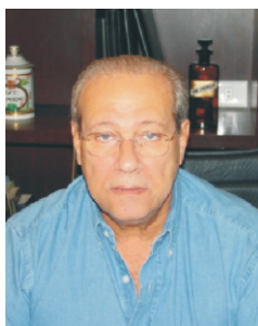
Benarc Arquitetura e Gerenciamento 21) 3204-4658 benarc@terra.com.br

O uso de carpetes tem-nos permitido obter economia, aconchego, elegância nos ambientes, bom desempenho na absorção de impactos e ruídos além de permitir desenhos criativos com fácil execução.