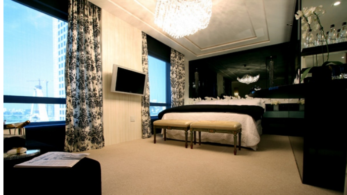
Casa Hotel - Suíte 407 - Brunette Fraccaroli