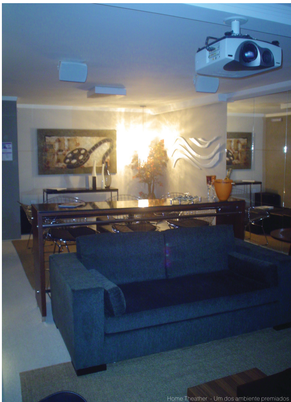
Home Theater - Um dos ambientes premiados

O Jundiaí Décor 2005 - Edição Villa Palladio - nasceu com o objetivo de valorizar os profissionais de arquitetura e decoração de Jundiaí e teve sua origem na atuação dos arquitetos Andréa Generoso e Nivaldo Callegari e dos empresários Dionísio Sponchiado e César Litaldi. Sua missão: ditar as tendências no setor de decoração, paisagismo e arquitetura da cidade. Entre setembro e outubro do ano passado o evento foi organizado em uma casa às margens da rodovia Anhanguera em um terreno de 8 mil metros quadrados. O projeto paisagístico de 2005 ficou a cargo de Nivaldo Callegari que se inspirou no estilo Palladiano, criado pelo italiano Andrea Palladio (1508-1580). O evento reuniu cerca de 60 empresas e vários profissionais para exibir toda a sua criatividade e beleza em projetos