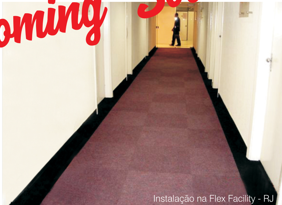
Instalação na Flex Facility - RJ

Além destes benefícios, o Berber Point em placas apresenta excelente custo x benefício, permite a criação de ambientes