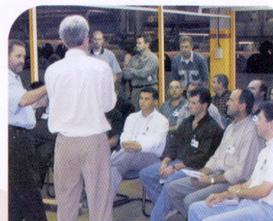
> Workshop reuniu colaboradores de todo o Brasil