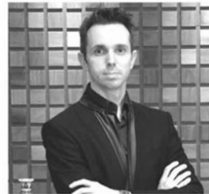
Arquiteto: Francisco Humberto Franck

CARPETE DIMENSION COOPERADO COM ESPAÇO DO PISO