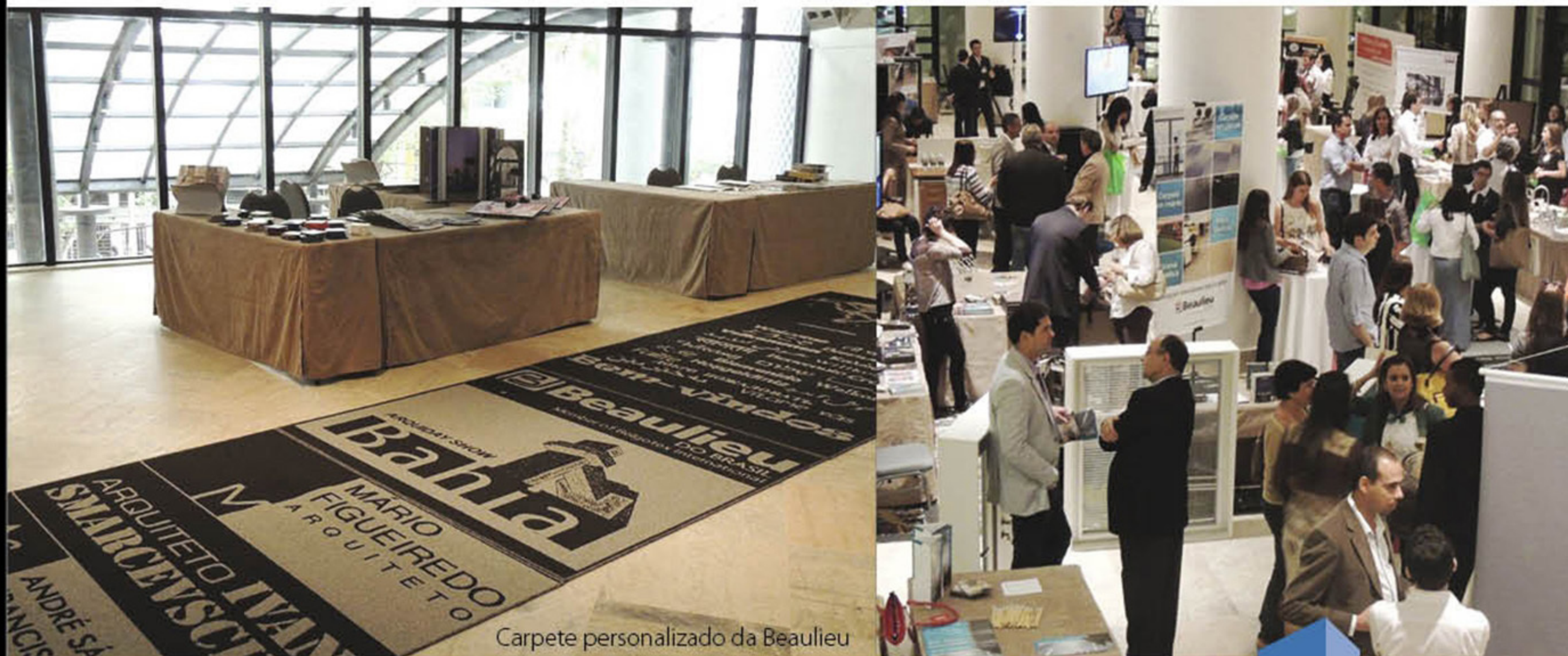
Carpete personalizado da Beaulieu

A Beaulieu do Brasil esteve presente em mais um importante evento na região nordeste, o Arquiday Show Bahia. Realizado pela Flex Eventos, em parceria com a ADEMI/BA, o evento aconteceu no dia 27 de agosto no Centro de Convenções do Hotel Sheraton em Salvador.