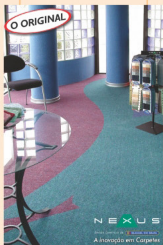
Berber Point 650 - faz a diferença

Estamos contentes com o sucesso que Berber Point 650® vem alcançando. O mercado já reconhece a excelente relação custo x benefício que este produto oferece. Com o lançamento do folheto " Berber Point 650® - fazendo a diferença " junto à várias instalações desenhadas que foram feitas, tivemos um aumento importante nas vendas desse produto. Abaixo, instalação executada por De Carpetts, de Curitiba.