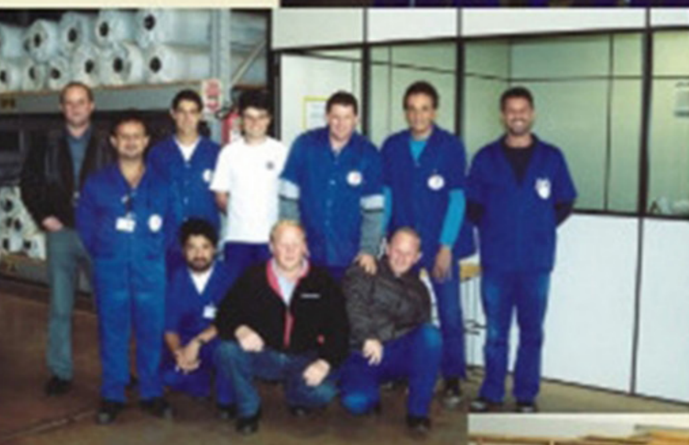
expedição e estoque