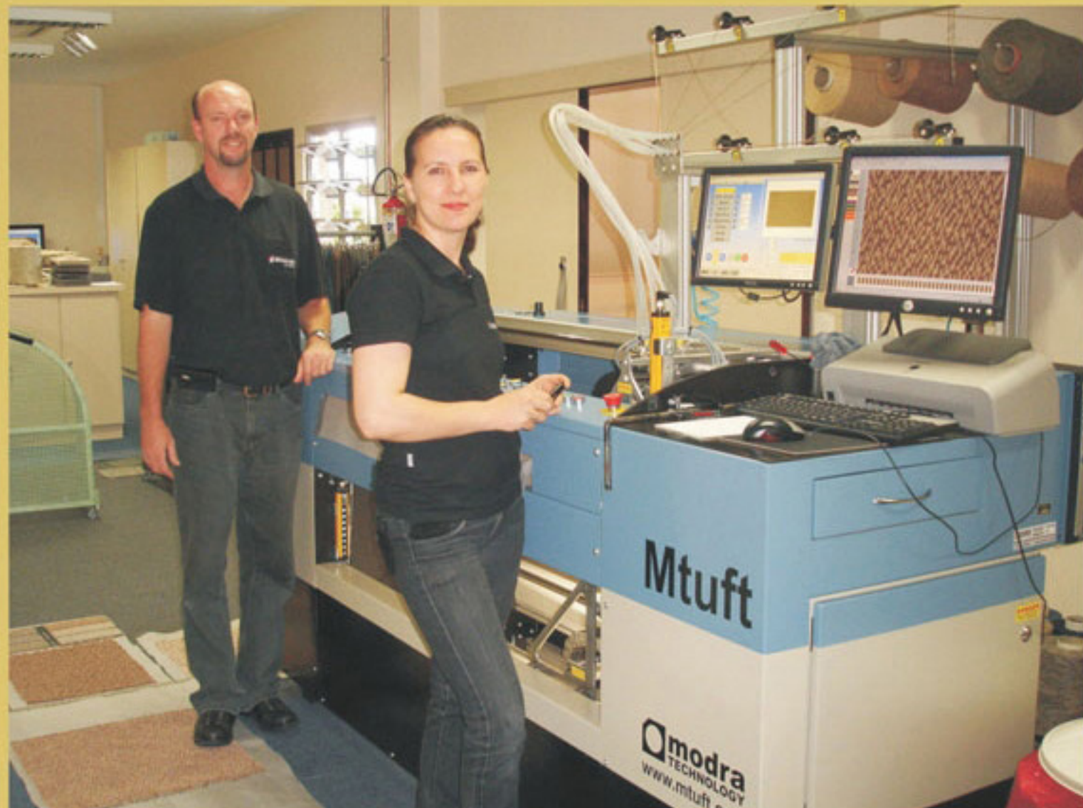
Máquina Mtuft para desenvolvimento de amostras

Na Beaulieu, um dos departamentos chave para o crescimento da empresa é o de desenvolvimento de novos produtos.