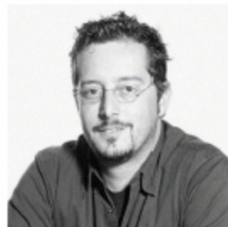
Arquiteto: Robson Gonzales

Sustentabilidade e acessibilidade inspiradas no Brasil