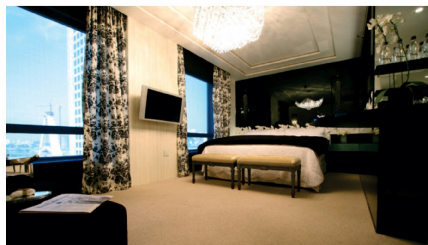
Casa Hotel - Suíte 407 - Brunette Fraccaroli