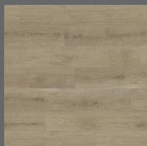
004 - Woodland Oak