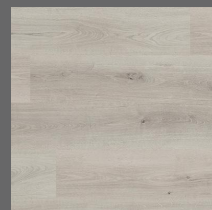
005 - Silver Oak