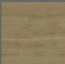
001 - Canyon Oak