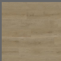
002 - Classic Oak