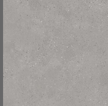
102 - Queens