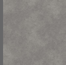
104 - Brooklyn