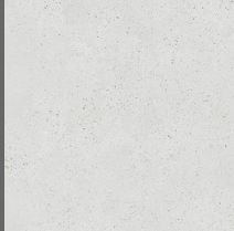
101 - Soho