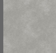
105 - Manhattan