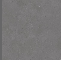
103 - Bronx