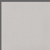
014 - Rock Salt - LRV-43 Sob encomenda