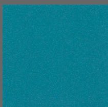
008 - Neptune - LRV-12