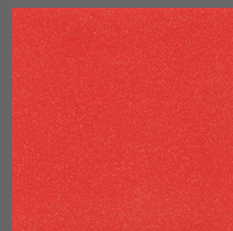
005 - Berry Red - LRV-14