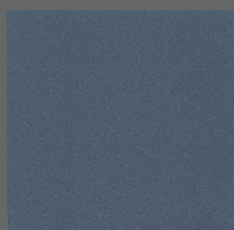
007 - Midnight Blue - LRV-12