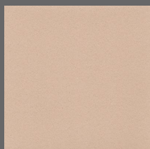
011 - Cappuccino - LRV-33 Sob encomenda