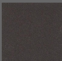
017 - Rich Black - LRV-07