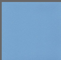
004 - Azure - LRV-31