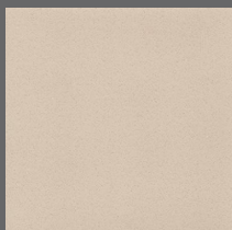
001 - Mocha - LRV-43