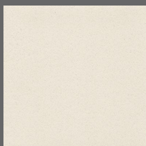
009 - Vanilla - LRV-63 Sob encomenda