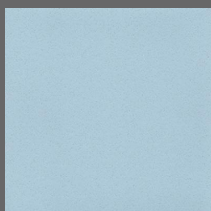
012 - Sea Breeze - LRV-44 Sob encomenda