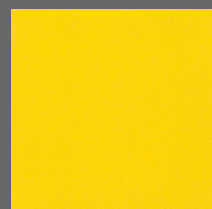
018 - Lemon Drizzle - LRV-54