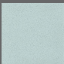
016 - Duck Egg - LRV-50 Sob encomenda