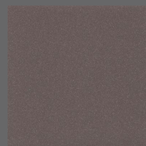
015 - Americano - LRV-12 Sob encomenda