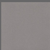
006 - Pebble Shore - LRV-21