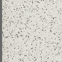
204 - Frosty Glen - LRV-65.3