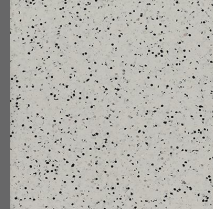
201 - Thunderstorm - LRV-46.3