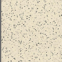
202 - Warm Haze - LRV-65.4