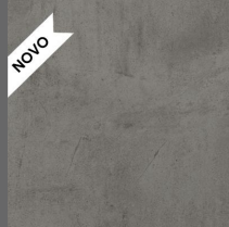
106 - Dark Station