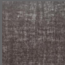
Grid - 306 Onyx Sob encomenda