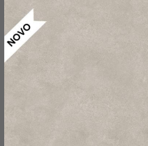
105 - Horizon