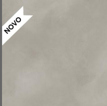
104 - Orbit