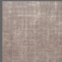
Grid - 307 Niquel Sob encomenda