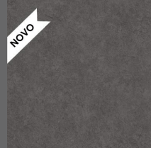
107 - Blackout