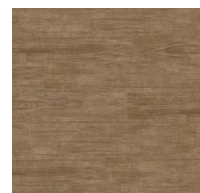
008 - Zeus