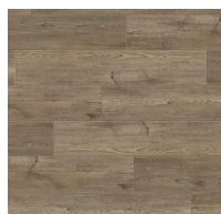
004 - Bow