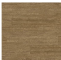
005 - Hades