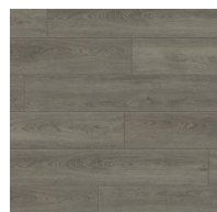
007 - Titan