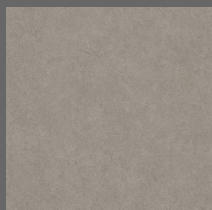
001 - Sandbox