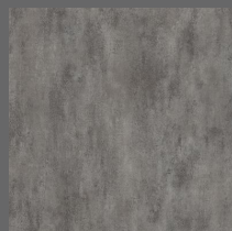
004 - Storm