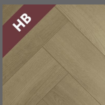
HB - 001 - Harmony Oak