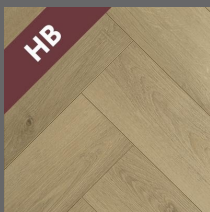
HB - 002 - Serenity Oak