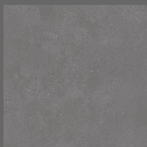
003 - Bronx