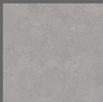
002 - Queens