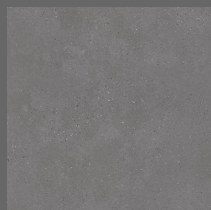
003 - Bronx