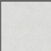
001 - Soho