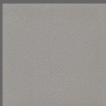
003 - Monsoon - LRV-25