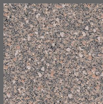
103 - Mortar - LRV-23