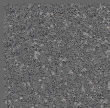
101 - Aurora Gray - LRV-15