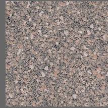
103 - Mortar - LRV-23