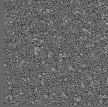
101 - Aurora Gray - LRV-15