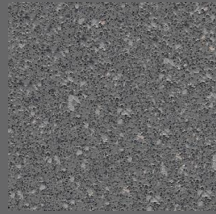
101 - Aurora Gray - LRV-15