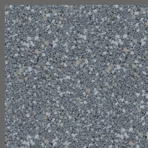
102 - Pearl Granite - LRV-19