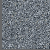
102 - Pearl Granite - LRV-19