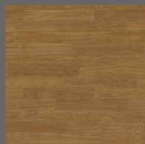
012 - Pine