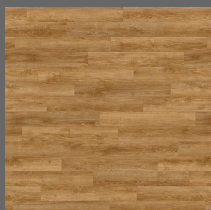
011 - Ebony