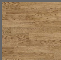
010 - Deckwood