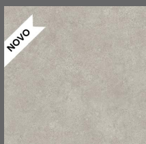
013 - Urban Grey