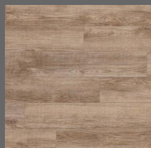
009 - Oak