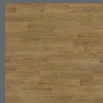
015 - Pecan