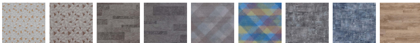
ABC - 001 Imagination