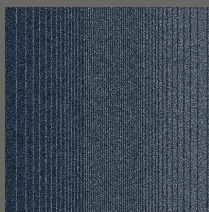
102 - Patagonia