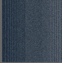
102 - Patagonia