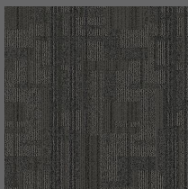
004 - Moka