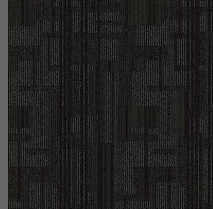
001 - Plush