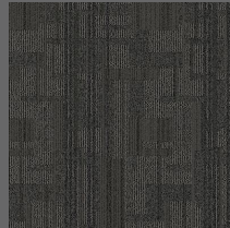
004 - Moka