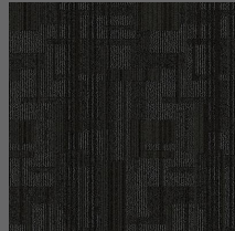
001 - Plush