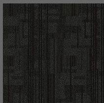
001 - Plush