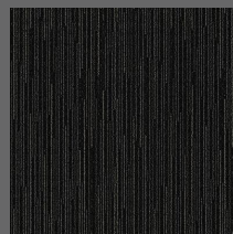
285 - Storm