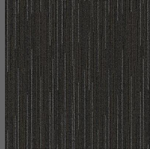
283 - Voyage