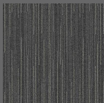
282 - Trace