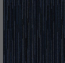
284 - Secret