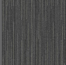
282 - Trace