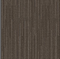
280 - Legacy