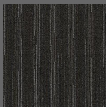
283 - Voyage