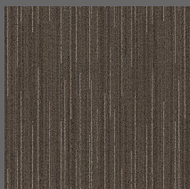
280 - Legacy