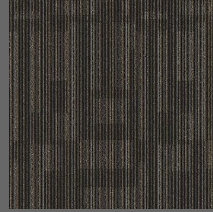
002 - Atom