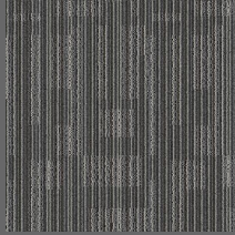
001 - Chip