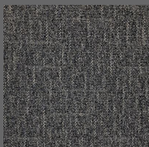
803 - Cromo