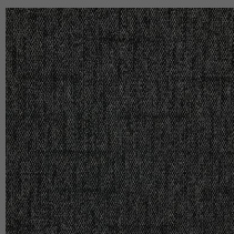
806 - Recharge