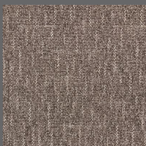
801 - Malibu