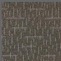
804 - Walker