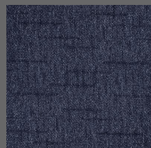
805 - River