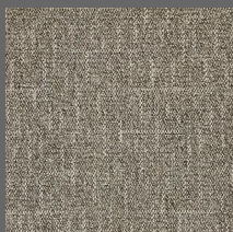
800 - Impala