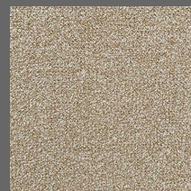
211 - Amira