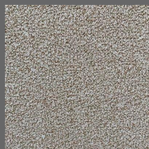
209 - Plage