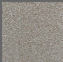
209 - Plage