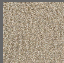
211 - Amira