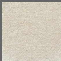
006 - Poeme