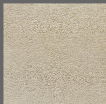
002 - Lush