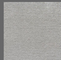
008 - Essencial