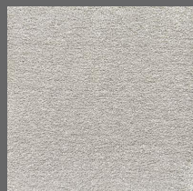
007 - Velvet