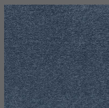
011 - Supreme