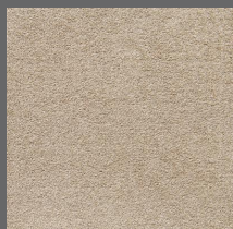
004 - Charm