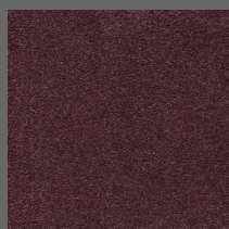
010 - Intense