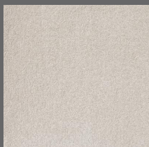
001 - Linen