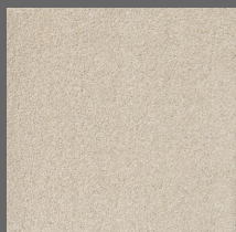
002 - Accolade