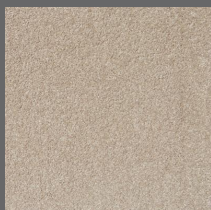
003 - Praise