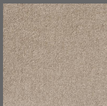
004 - Dandy