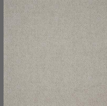
102 - Miragem