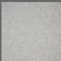
101 - Névoa