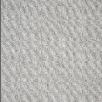
101 - Névoa