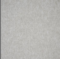
101 - Névoa