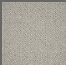
102 - Miragem