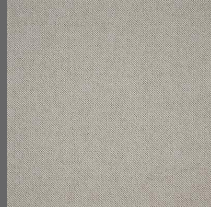
102 - Miragem