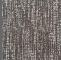
313 - Autumn