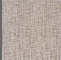
312 - Summer