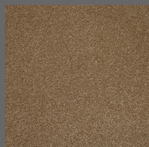
402 - Big Ben