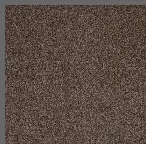
403 - Tower