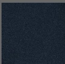
406 - River