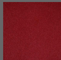
404 - Queen