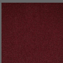
405 - Palace