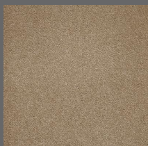
400 - Tate