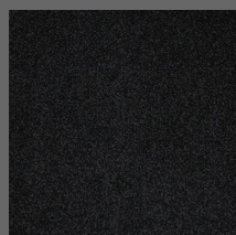
411 - Cab