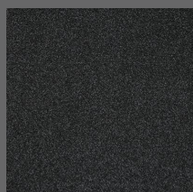
410 - Piccadilly