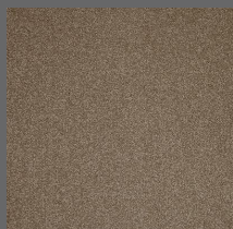
401 - Baker