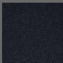
407 - Trafalgar