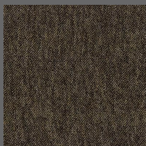
003 - Juno