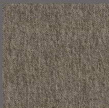
001 - Eros