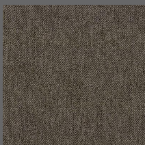
002 - Íris