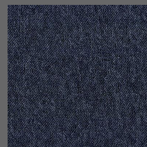
005 - Ceres