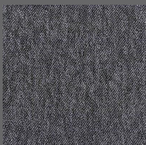
006 - Davida