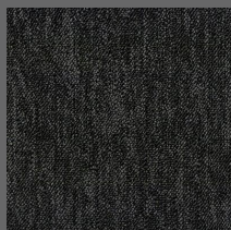
008 - Órbita