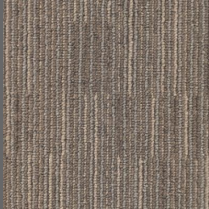
405 - Direct