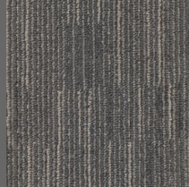
406 - Frame