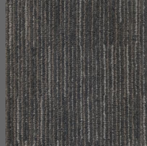
407 - Space