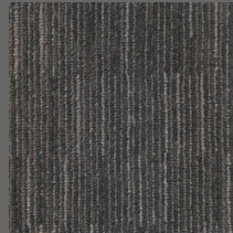
407 - Space