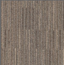
405 - Direct