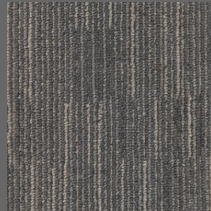
406 - Frame