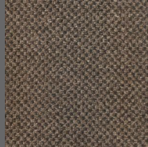
491 - Itajaí