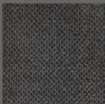
488 - Guartelá