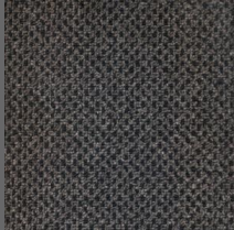
488 - Guartelá