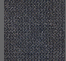
493 - Abruços