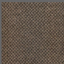
491 - Itajaí