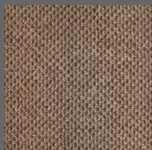
490 - Roraima