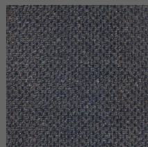
493 - Abruços