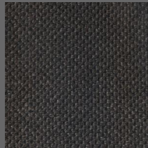
494 - Vila Velha