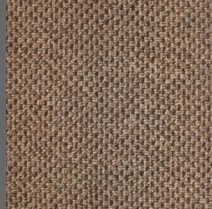
490 - Roraima