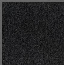
100 - Granito