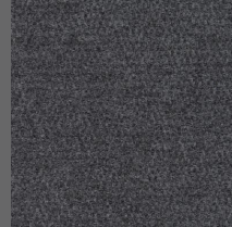
805 - Grey