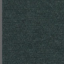
803 - Green