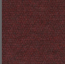
802 - Red