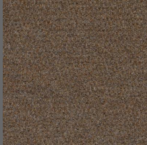
800 - Lever