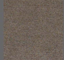
806 - Bege