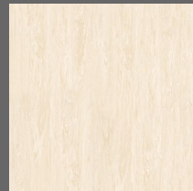
009 - Carnelian Beige - LRV-61