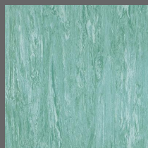
017 - Turquoise - LRV-31 Sob encomenda