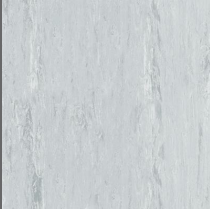
001 - Fossil - LRV-41