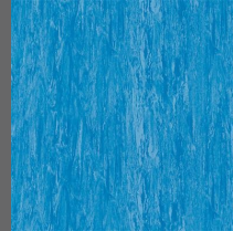
004 - Tanzanite Blue - LRV-19