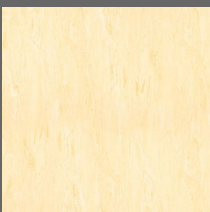
024 - Opal - LRV-60