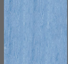
005 - Azure - LRV-26