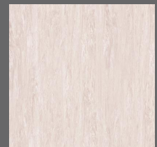
022 - Rose Quartz - LRV-56