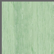
016 - Connemara Green - LRV-35