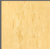
007 - Citrine - LRV-46