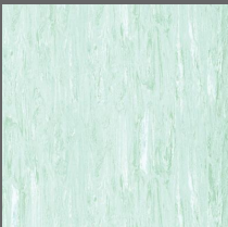
006 - Peridot Green - LRV-55