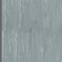
002 - Flint - LRV-25