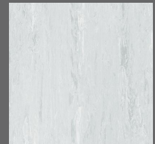
010 - Pumice - LRV-54