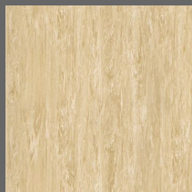
012 - Dolomite - LRV-41