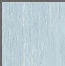
013 - Blue Nickel - LRV-39 Sob encomenda