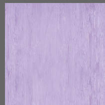
015 - Amethyst - LRV-36