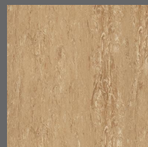
023 - Sablee Beige - LRV-29 Sob encomenda