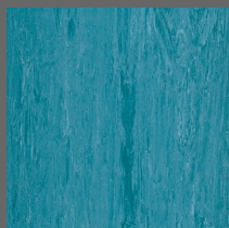
018 - Dark Sapphire - LRV-18 Sob encomenda