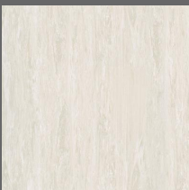
011 - Porcelain - LRV-58