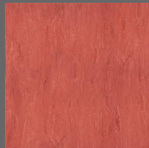
008 - Ruby - LRV-14