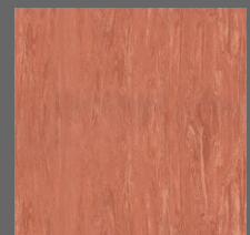
020 - Ironstone - LRV-18 Sob encomenda