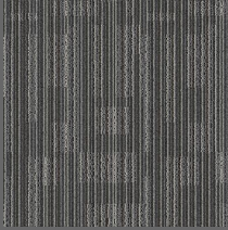
001 - Chip